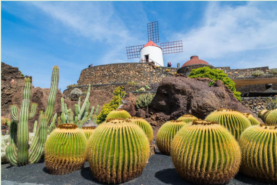
Jardín de Cactus. Homenaje a César Manrique Lanzarote (Las Palmas)